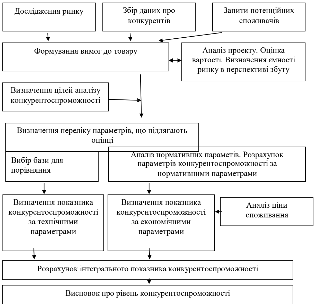
Рис. 2.1. Типова схема оцінки конкурентоспроможності підприємств

В процесі дослідження конкурентоспроможності підприємств студентам слід застосувати декілька методів оцінки для забезпечення комплексного підходу в дослідженні.