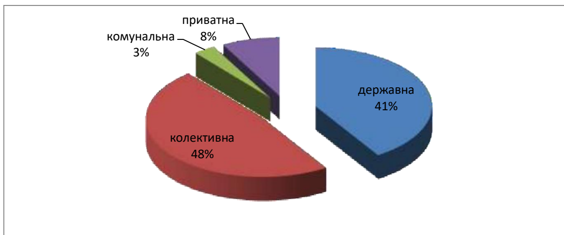
Рис 2.3. Поділ готелів за формами власності у м.Києві