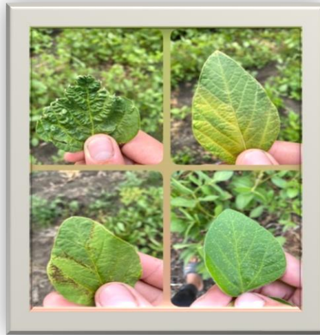
Рис. 1. Хвороби сої в умовах Дністровського району Чернівецької області (фото автора)

За нашими дослідженнями сорт Галлек є стійкішим до ураження хворобами. Відсоток ураження септоріозу та інших хвороб був мінімальний (не більш ніж 2%). На сорті Аріса було ураження 30% хворобами, за дії препаратів становило 6%.