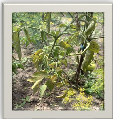
Рис.1. Ознаки фітофторозу томатів на сорті Ісполін

Розвивається фітофтороз надшвидко, за менше ніж 2 тижні може заразити всі рослини на величезному полі та привести втрати до 70% врожаю. З уражених рослин з дощем і вітром, через інструменти, закладені в компост рослинні рештки, спори потрапляють в землю та коріння, разносяться на величезні території, де знову зберігаються до наступного циклу розвитку [2].