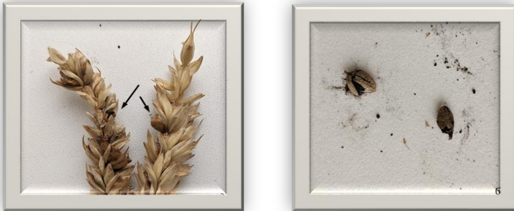
Рис. 1. а - уражене насіння твердою сажкою в колосі пшениці; б – сорус з теліоспорами

Для ідентифікації збудників сажкових хвороб у насінні необхідно застосовувати спеціальні методи. Наприклад, для виявлення зараженості летючої сажки використовують метод аналізу зародків, де і локалізується інфекція. Для виявлення твердої сажки пшениці проводять аналіз наявності спор патогенного організму на поверхні насіння (рис. 1) [1,2].