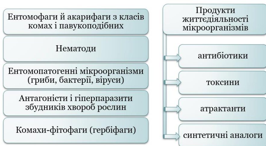
Рис. 1. Комплекс біологічних засобів для захисту рослин [1]

Погіршення стану сільськогосподарських угідь призвело до того, що з кожних 10 гектарів в задовільному стані наразі знаходиться лише один, що в майбутньому може призвести до проблем із забезпеченням населення країни продовольчими ресурсами. Відомо, що в окремі роки втрати врожаю від шкідників, хвороб і бур'янів в можуть досягати 20–30% [1]. Одним з ефективних шляхів вирішення цієї проблеми є впровадження сучасних агротехнологій вирощування сільськогосподарських культур, складовим елементом яких є біологічний захист рослин, який передбачає отримання екологічно безпечної продукції високої якості за умови збереження біологічного різноманіття біоценозів шляхом використання проти шкідливих організмів їх природних ворогів та продуктів їхньої життєдіяльності (рис. 1).