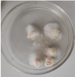
Рис. 2. Зараження насіння фузаріозом (Олійник В.С.).

Метою роботи було дослідити особливості прояву фузаріозу качанів кукурудзи і спланувати заходи захисту в умовах приватних підприємств Бориспільського району Київської області.