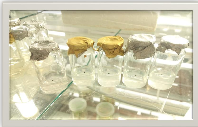
Рис. 1. Стерильне насіння Lophophora williamsii на МС (14-а доба культивування)

Розмноженню різних представників родини кактусових в асептичних умовах присвячено багато наукових робіт. Основна умова отримання стерильної рослини – це підбір стерилізуючого розчину та часу стерилізації. Для отримання асептичної культури Lophophora williamsii , в якості експланта ми використали насіння (розмір до 1 мм). Насіння Lophophora williamsii стерилізували розчином білизни у співвідношенні 1:3 (20 хв.). Живильне середовище для введення в культуру Lophophora williamsii – Мурасіге-Скуга [2].