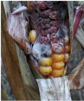
Рис. 1. Фузаріоз качанів кукурудзи (Олійник В.С.).