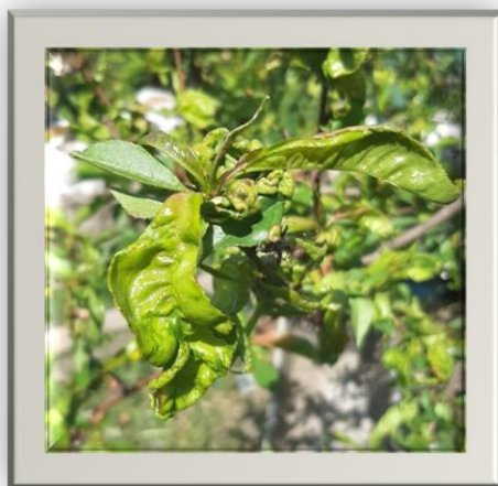
Рис. 1 Кучерявість листків персика

Кучерявість листків (збудник - Taphrina deformans ), одне з найшкідливіших захворювань персика. Хвороба поширена у всіх регіонах вирощування персиків, в Україні досить поширена у південних та південно-західних областях [1].