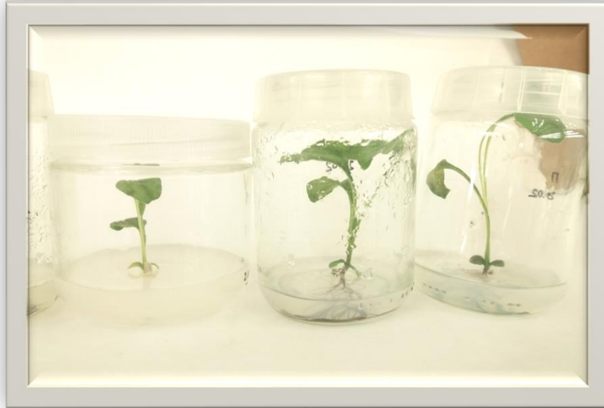
Рис. 1. Echinacea в культурі in vitro

Ефективність стерилізації Echinacea становить – 100 %. Слід зазначити, що проростання насіння в in vitro проходить повільно.