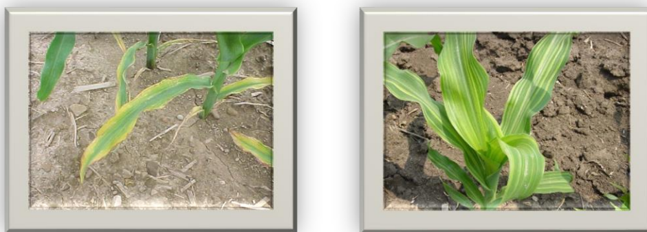
Рис. 1. Ознаки хлорозу на кукурудзі

Неінфекційні захворювання можуть викликати такі симптоми, як в'янення, відставання в рості, пожовтіння, деформація рослинної тканини або загибель рослинної тканини. Симптоми неінфекційних захворювань часто нагадують симптоми, викликані комахами або збудниками. Наприклад, симптоми дефіциту поживних речовин можуть нагадувати симптоми захворювання кореневою гнилі.