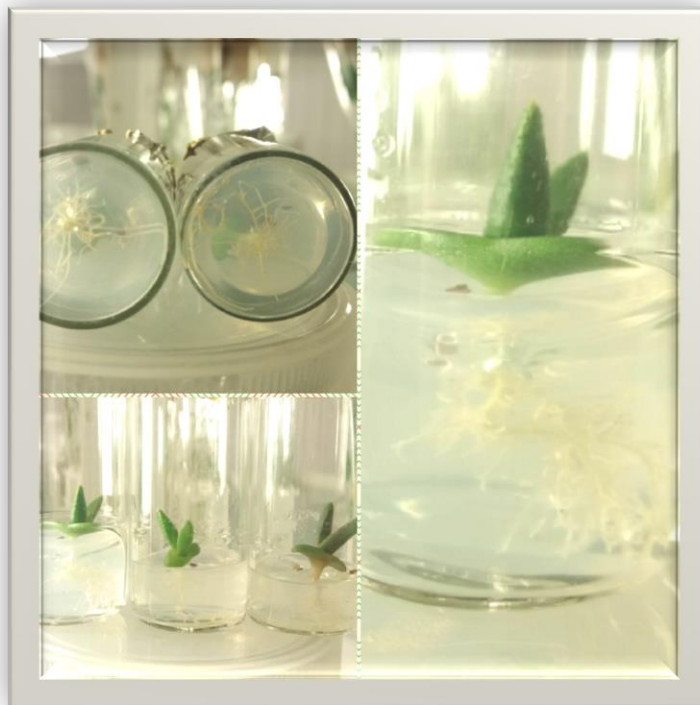
Рис. 1. Aloinopsis rubrolineat в культурі in vitro

Слід зазначити, що ефективність підібраної стерилізації становить – 97 %. Крім того, через 14 діб стерильне насіння Aloinopsis rubrolineat почало проростати. Для проростання насіння та його розвитку цілком прийнятним є тверде агаризоване живильне середовище відповідно до базового пропису Мурасіге-Скуга. Через 30 діб культивування Aloinopsis rubrolineat , ми отримали добре зростаючі, сформовані сукулентні рослини з двома стравжніми листками та сформованою мичкуватою кореневою системою (рис. 1).