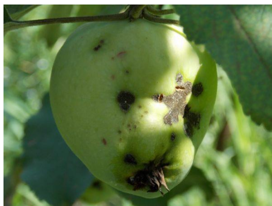
Рис.1. Парша на плоді яблуні

Причини виникнення: разносять птахи, комахи, пориви вітру; інтенсивне вирощування дерев, якщо порушена схема посадки — суперечки швидко переносяться з хворих екземплярів на здорові; вологий клімат при температурі вище 0 ° С і нестабільними погодними умовами.