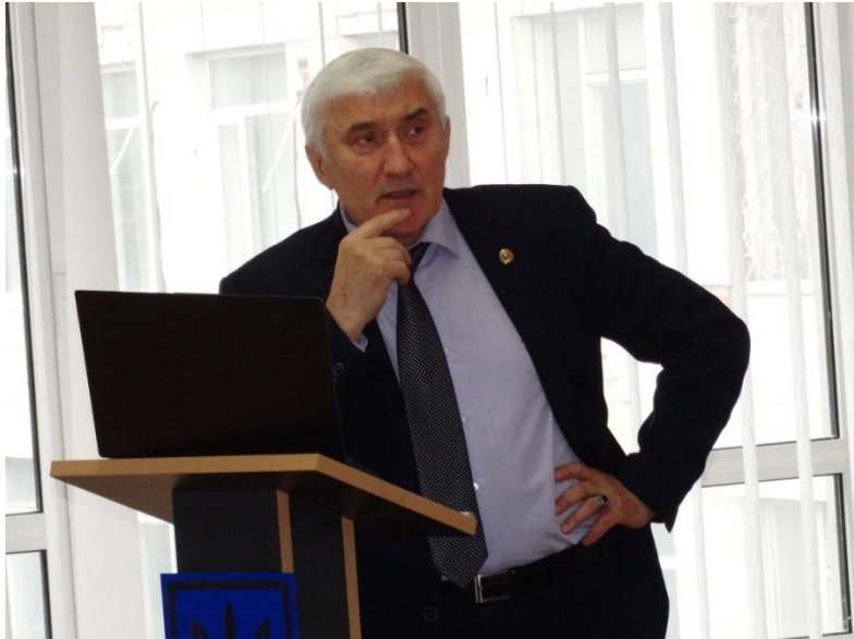
Академік В.В. Адамчук

сумісно виданими монографіями, підручниками, статтями (в тому числі і в базі Scopus) і патентами України на винаходи. Крім того В.В. Адамчук очолює Наглядову раду університету.