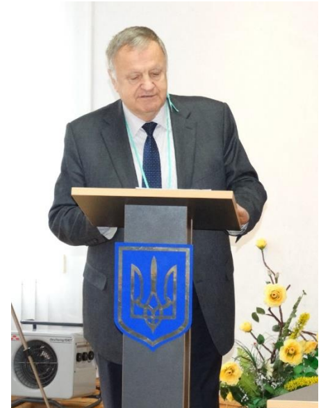
Академік В.М. Булгаков

Також були заслухані й інші актуальні наукові доповіді, що викликали зацікавленість у присутніх. Особливо це стосувалось питань автоматизованих та роботизованих систем, які зараз почали широко розповсюджуватися у світовому сільському господарстві.