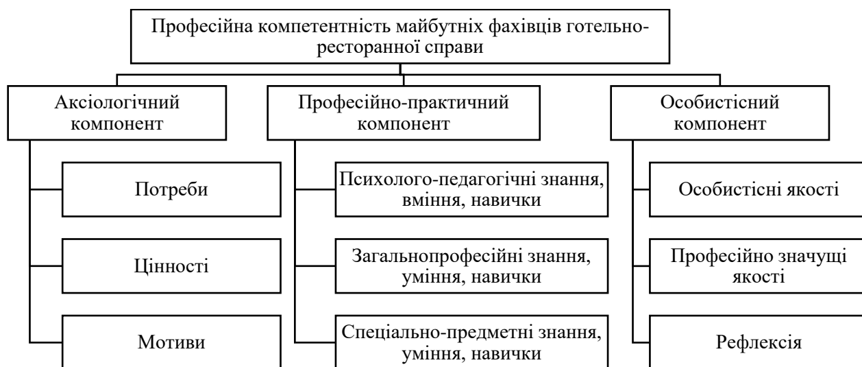
Рис. 1. Структура професійної компетентності майбутніх фахівців готельно-ресторанної справи

Проблема ролі практичної підготовки у формуванні професійних компетентностей майбутніх фахівців готельно-ресторанної справи активно досліджується українськими та зарубіжними науковцями. О. Каролоп розглядає практичну підготовку як ключовий чинник підвищення якості університетської освіти [6]. В. Стрельников і Л. Лебедик акцентують увагу на формуванні ключових і професійних компетентностей у сфері гостинності а також аналізують трансформацію компетентностей в умовах інтернаціоналізації [7].