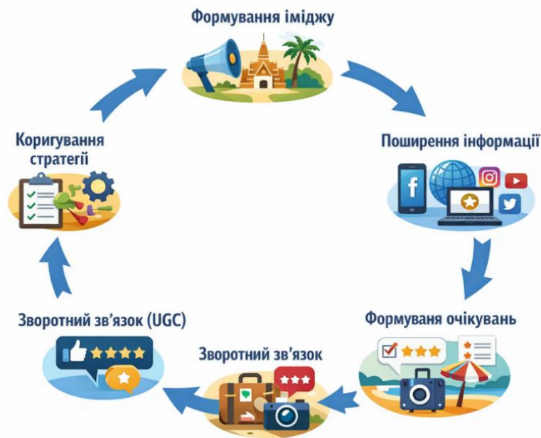
Рис.1. Цикл впливу комунікації на розвиток галузі

Екологічні ініціативи, відновлення морських екосистем і розвиток ком'юніті-туризму (СВТ) комунікуються як пріоритети сталого розвитку. Це дозволяє Таїланду трансформувати імідж із напрямку масового туризму у бік свідомого відпочинку, залучаючи високодохідні сегменти ринку [4].