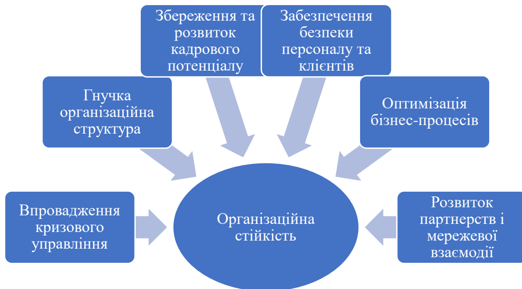
Рис. 1. Рекомендації для підвищення організаційної стійкості туристичного підприємства у воєнний період

Не менш важливим критерієм оцінки є рівень цифровізації діяльності туристичного підприємства. Активне використання онлайн-платформ, дистанційного бронювання, цифрового маркетингу та соціальних мереж дозволяє зменшити витрати, розширити аудиторію та підтримувати зв'язок зі споживачами навіть за умов обмеженої мобільності.