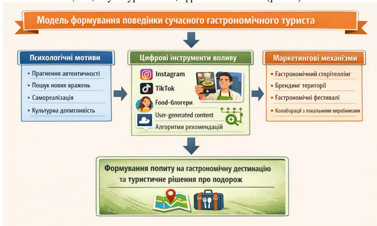
Рис. 1. Модель формування поведінки сучасного гастрономічного туриста

Для узагальнення ключових факторів, що формують поведінку сучасного гастрономічного туриста, доцільно представити концептуальну модель взаємодії психологічних, соціокультурних та цифрових чинників (рис. 1).