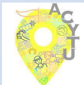
Асоціація дитячого та молодіжного туризму України