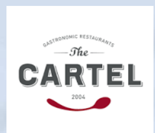
Холдинг CARTEL, Україна