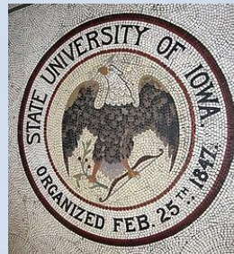
Університет штату Айова, США