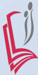
Akadémia odborného vzdelávania Merkur n.o. Kaluža 264, 072 36 Kaluža