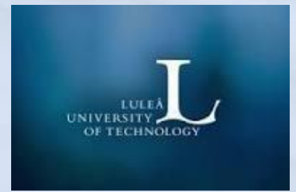
Технологічний університет Лулео, Швеція