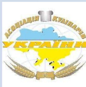
Асоціація кулінарів України